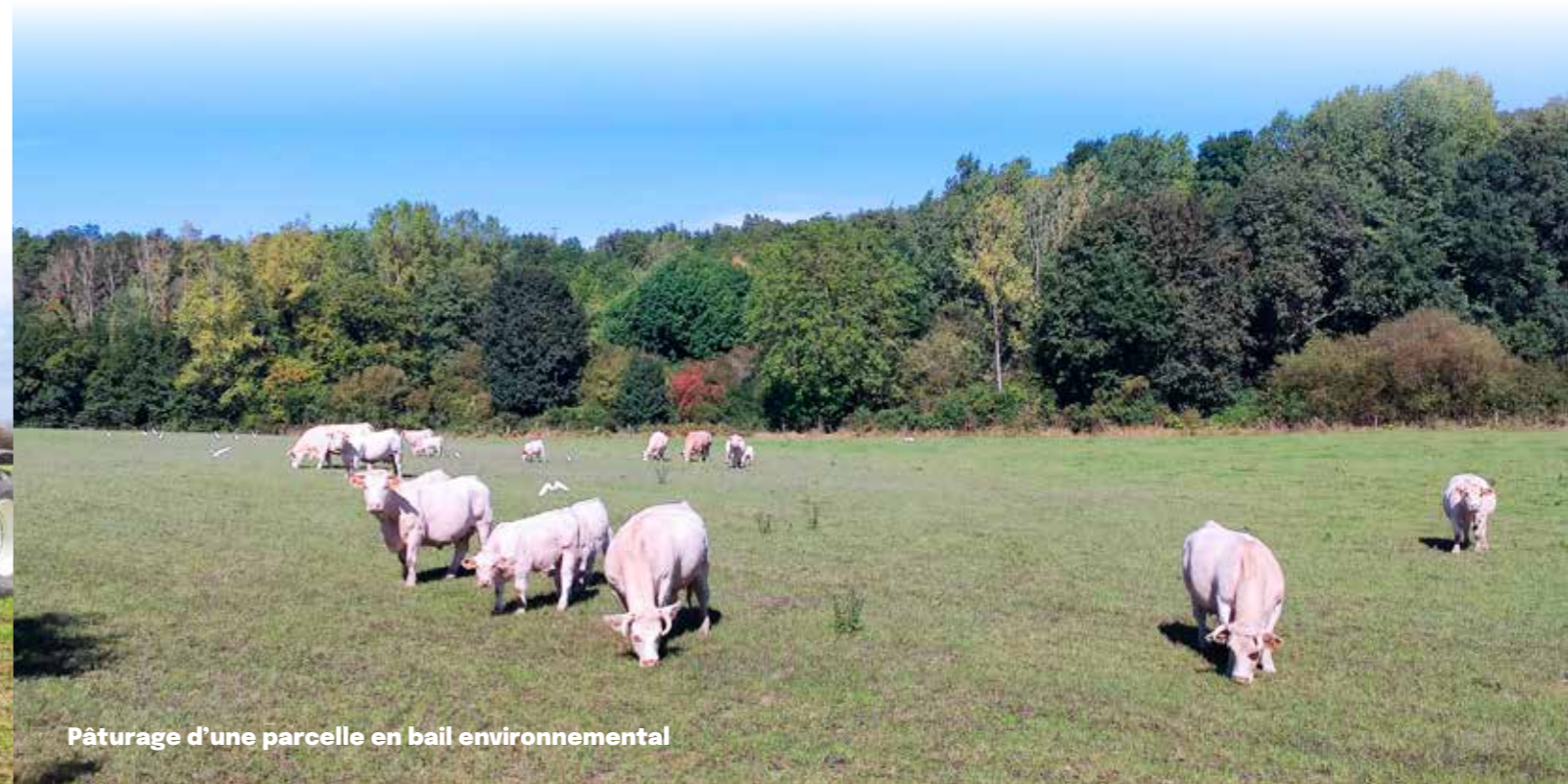
Pâturage d'une parcelle en bail environnemental

Certaines parcelles acquises par le SEVT sont mises en gestion au Conservatoire d'Espaces Naturels de Nouvelle-Aquitaine car elles présentent un enjeu de préservation des pelouses sèches qui constituent des habitats d'intérêt écologique remarquable.