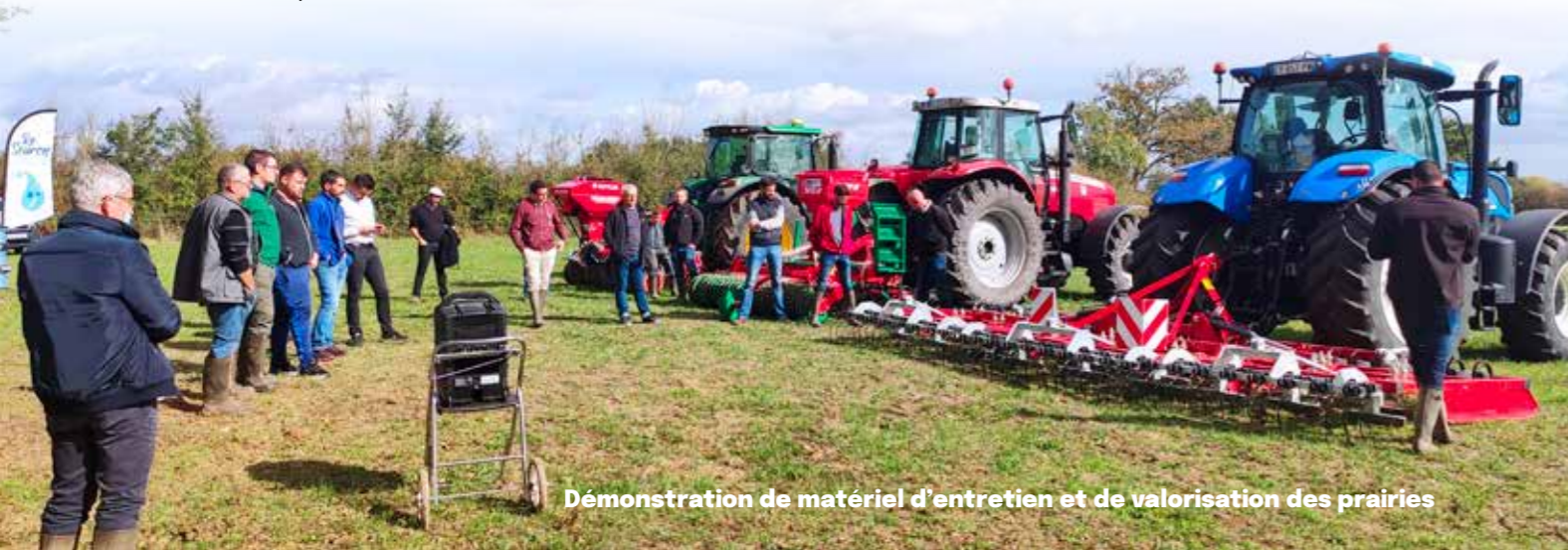
Démonstration de matériel d'entretien et de valorisation des prairies