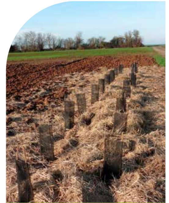
Plantation de haies

Au programme : plantation de haies avec la Fédération des Chasseurs des Deux-Sèvres et découverte du captage des sources de Seneuil ainsi que du château d'eau de la Charpenterie. La plantation de haies était également l'occasion de faire découvrir aux élèves les nombreux bénéfices des haies : limiter l'érosion, favoriser l'infiltration, fournir des refuges et des sources d'alimentation à la faune sauvage...).