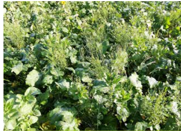
Colza associé, notamment à des légumineuses